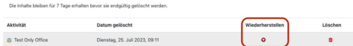
Bild: aus Papierkorb wiederherstellen