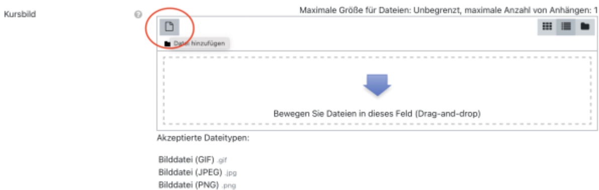
Bild: Dateiauswahl für Kursbild