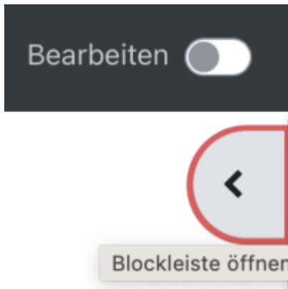
Bild: Blöcke anzeigen in Moodle

Um die Blockleiste auf der rechten Seite einzublenden, klicken Sie ganz rechts oben auf „Blockleiste anzeigen“: