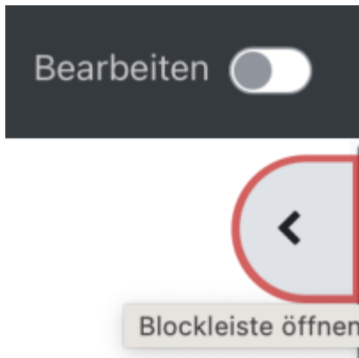
Bild: Blöcke anzeigen in Moodle

Um die Blockleiste auf der rechten Seite einzublenden, klicken Sie ganz rechts oben auf „Blockleiste anzeigen“: