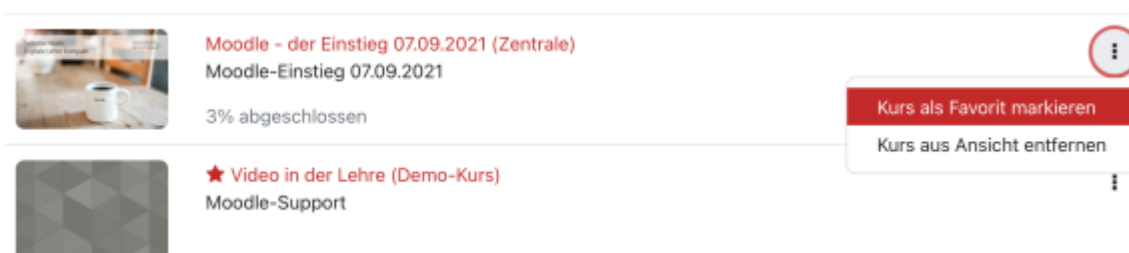
Bild: Favoriten markieren in Moodle

Zur besseren Übersicht können Sie auf dem Dashboard Kurse als Favoriten markieren: