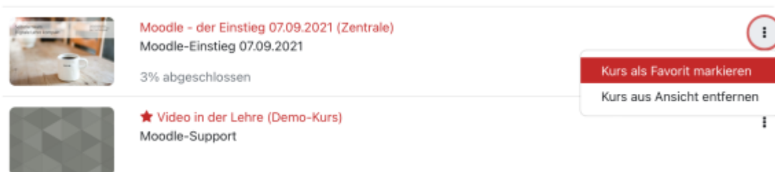
Bild: Favoriten markieren in Moodle

Zur besseren Übersicht können Sie auf dem Dashboard Kurse als Favoriten markieren: