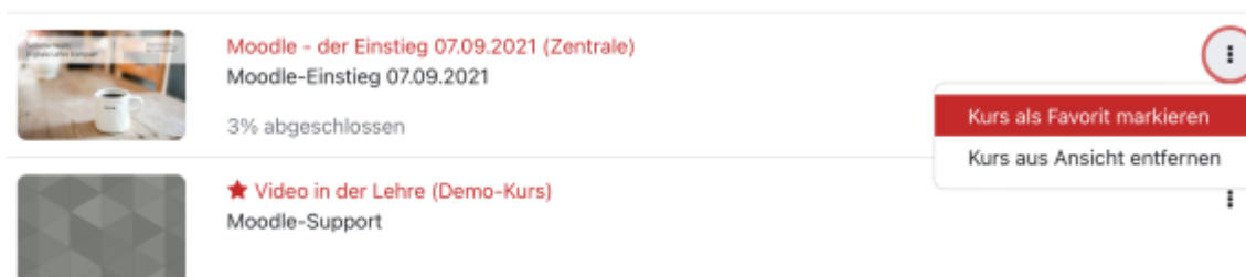
Bild: Favoriten markieren in Moodle

Zur besseren Übersicht können Sie auf dem Dashboard Kurse als Favoriten markieren: