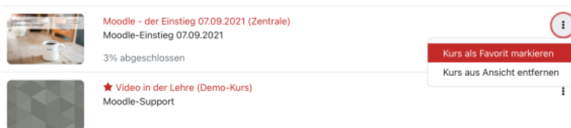
Bild: Favoriten markieren in Moodle

Zur besseren Übersicht können Sie auf dem Dashboard Kurse als Favoriten markieren: