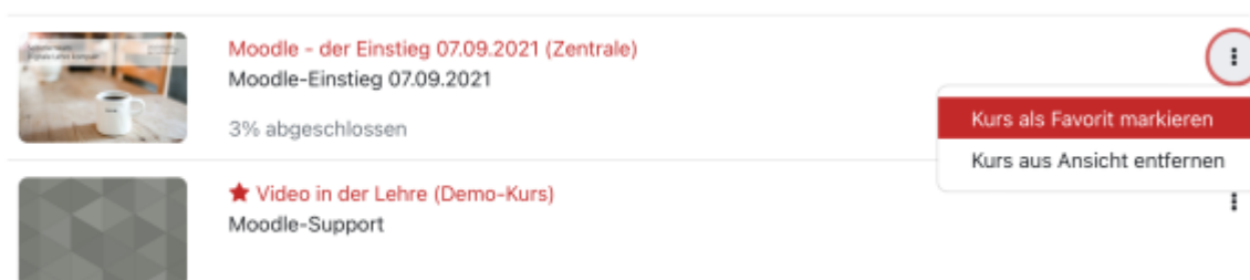
Bild: Favoriten markieren in Moodle

Zur besseren Übersicht können Sie auf dem Dashboard Kurse als Favoriten markieren: