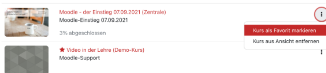
Bild: Favoriten markieren in Moodle

Zur besseren Übersicht können Sie auf dem Dashboard Kurse als Favoriten markieren: