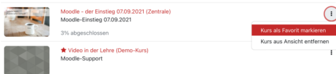
Bild: Favoriten markieren in Moodle

Zur besseren Übersicht können Sie auf dem Dashboard Kurse als Favoriten markieren: