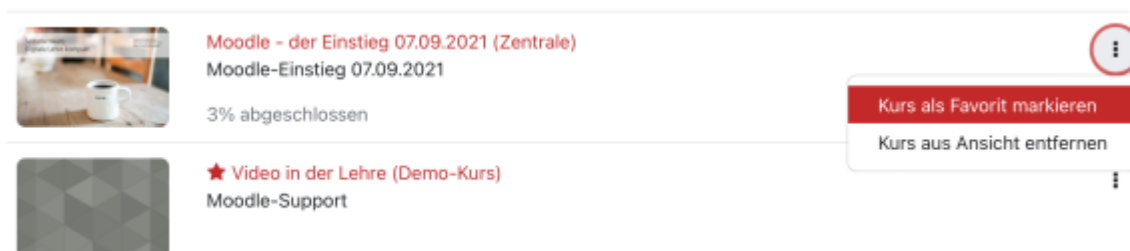
Bild: Favoriten markieren in Moodle

Zur besseren Übersicht können Sie auf dem Dashboard Kurse als Favoriten markieren: