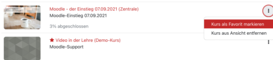
Bild: Favoriten markieren in Moodle

Zur besseren Übersicht können Sie auf dem Dashboard Kurse als Favoriten markieren: