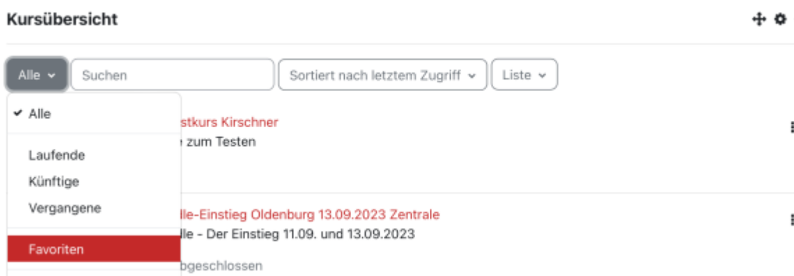
Bild: Favoriten anzeigen in Moodle

Um nur favorisierte Kurse in dieser Liste anzuzeigen, legen Sie folgende Einstellung fest: