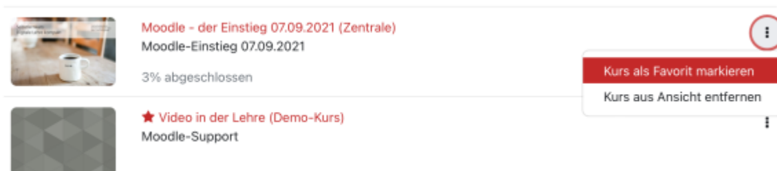
Bild: Favoriten markieren in Moodle

Zur besseren Übersicht können Sie auf dem Dashboard Kurse als Favoriten markieren: