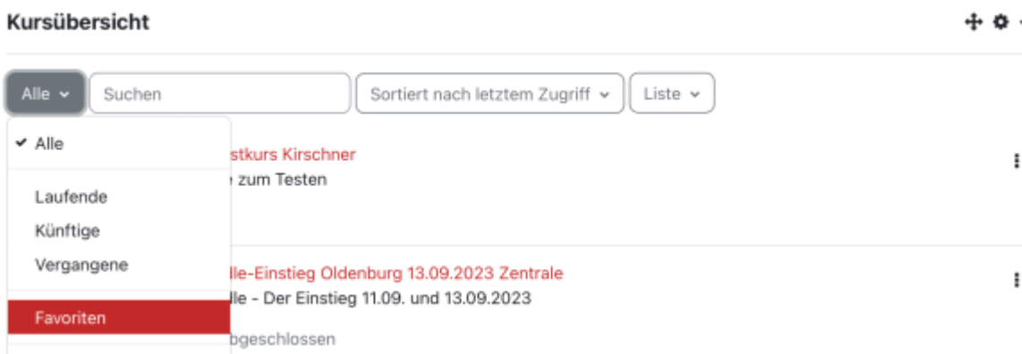
Bild: Favoriten anzeigen in Moodle

Um nur favorisierte Kurse in dieser Liste anzuzeigen, legen Sie folgende Einstellung fest: