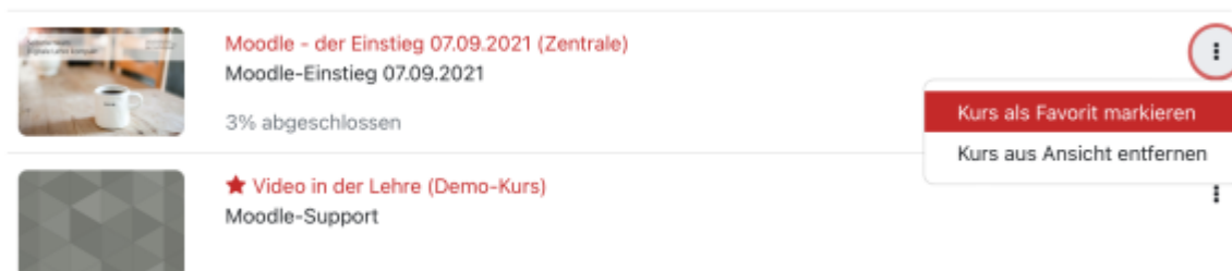
Bild: Favoriten markieren in Moodle

Zur besseren Übersicht können Sie auf dem Dashboard Kurse als Favoriten markieren: