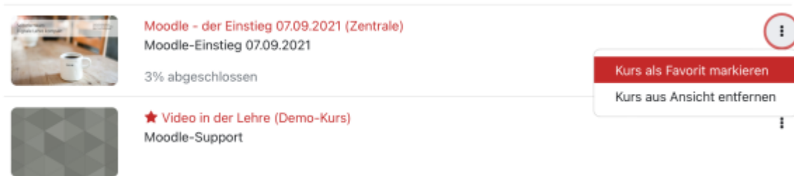
Bild: Favoriten markieren in Moodle

Zur besseren Übersicht können Sie auf dem Dashboard Kurse als Favoriten markieren: