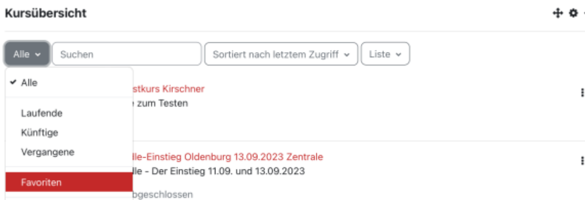
Bild: Favoriten anzeigen in Moodle

Um nur favorisierte Kurse in dieser Liste anzuzeigen, legen Sie folgende Einstellung fest: