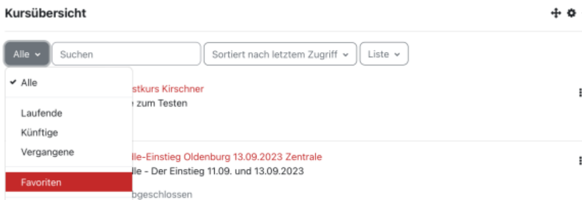
Bild: Favoriten anzeigen in Moodle

Um nur favorisierte Kurse in dieser Liste anzuzeigen, legen Sie folgende Einstellung fest: