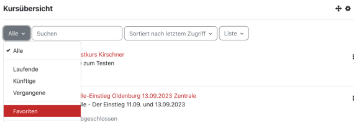
Bild: Favoriten anzeigen in Moodle

Um nur favorisierte Kurse in dieser Liste anzuzeigen, legen Sie folgende Einstellung fest: