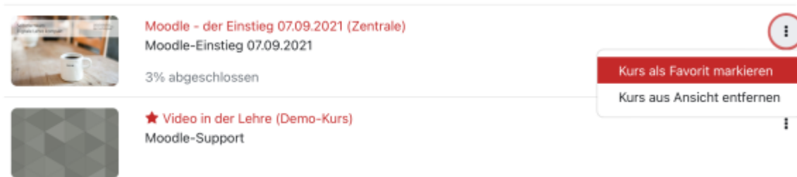
Bild: Favoriten markieren in Moodle

Zur besseren Übersicht können Sie auf dem Dashboard Kurse als Favoriten markieren: