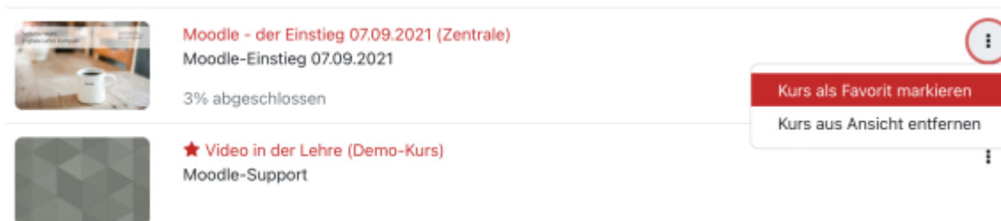
Bild: Favoriten markieren in Moodle

Zur besseren Übersicht können Sie auf dem Dashboard Kurse als Favoriten markieren: