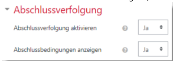
Bild: Abschlussverfolgung aktivieren

Aktivieren in den Kurs-Einstellungen (Bereich Abschlussverfolgung ):