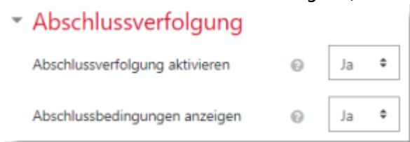
Bild: Abschlussverfolgung aktivieren

Aktivieren in den Kurs-Einstellungen (Bereich Abschlussverfolgung ):