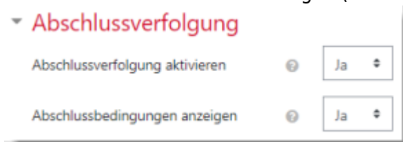
Bild: Abschlussverfolgung aktivieren

Aktivieren in den Kurs-Einstellungen (Bereich Abschlussverfolgung ):