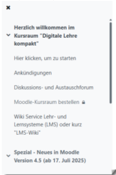
Bild: Kurs-Index im Moodle-Kursraum

Lange Überschriften wurden bislang in der seitlichen Navigation („Kurs-Index“) abgeschnitten. Durch den jetzt eingestellten Zeilenumbruch wird die Lesbarkeit und Orientierung im Kurs verbessert.