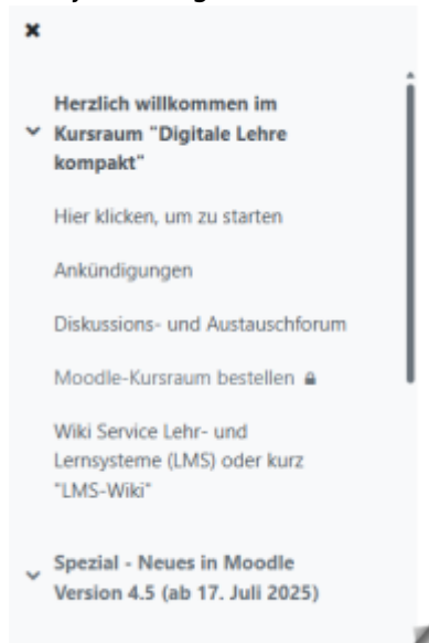
Bild: Kurs-Index im Moodle-Kursraum

Lange Überschriften wurden bislang in der seitlichen Navigation („Kurs-Index“) abgeschnitten. Durch den jetzt eingestellten Zeilenumbruch wird die Lesbarkeit und Orientierung im Kurs verbessert.