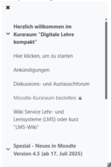
Bild: Kurs-Index im Moodle-Kursraum

Lange Überschriften wurden bislang in der seitlichen Navigation („Kurs-Index“) abgeschnitten. Durch den jetzt eingestellten Zeilenumbruch wird die Lesbarkeit und Orientierung im Kurs verbessert.