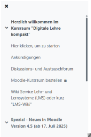
Bild: Kurs-Index im Moodle-Kursraum

Lange Überschriften wurden bislang in der seitlichen Navigation („Kurs-Index“) abgeschnitten. Durch den jetzt eingestellten Zeilenumbruch wird die Lesbarkeit und Orientierung im Kurs verbessert.