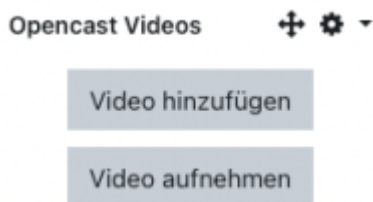
Bild: Block „Opencast Videos“ - nur die Rolle „Teacher“ kann den Block sehen.

Um Opencast zu nutzen, den Block „Opencast Videos“ im Kurs einfügen: „Bearbeiten einschalten“ , dann in der linken Navigationsleiste ganz unten „+ Block hinzufügen“ wählen, dort „Opencast Videos“ wählen.