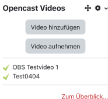
Bild: Block „Opencast Videos“ - nur die Rolle „Teacher“ kann den Block sehen.

Um Opencast zu nutzen, müssen Sie den Block „Opencast Videos“ im Kurs einfügen. Folgen Sie gern unserer Anleitung zum Einfügen von Blöcken .